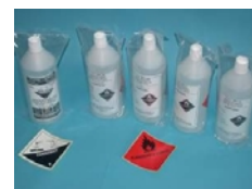
Elektrolytflüssigkeit und Boosterflüssigkeit Methanol