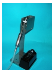
Brennerständer und Brennerhandstück (ohne Funkenzünder)