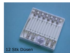
12 Stk Düsen