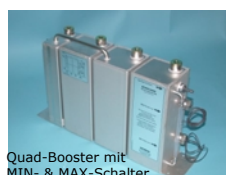
Quad-Booster mit MIN- & MAX-Schalter

alle Modelle gleiche Form und Aussenabmessungen. Gewichte verschieden.